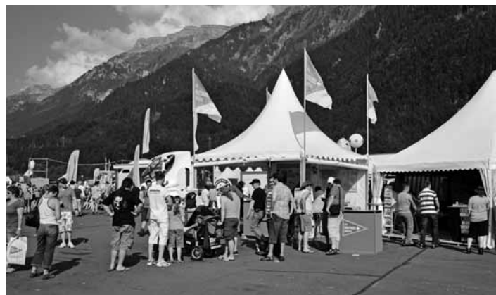
Informationsstand am Truck & Country Interlaken

Chauffeur wird wieder ein interessanter Job mit besseren Zukunftsaussichten.