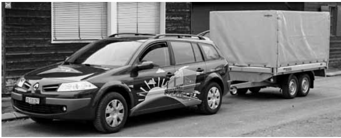
Für die Ausbildung unterwegs

2009 über 11'000 Teilnehmertage. Im Jahr 2008 wurden die Kosten noch durch den Verkehrssicherheitsfonds und den Verband übernommen. Der administrative Aufwand war sehr gering. Für das Jahr 2009 wurde der Aufwand grösser. Insbesondere Qualitätskontrolle und Administration mussten aufgrund der Vorschriften erweitert werden. Durch die Einführung der CZV hat der Verkehrssicherheitsfonds seine Unterstützung massiv reduziert. Der Aufwand musste hauptsächlich von den Teilnehmern oder ihren Arbeitgebern bezahlt werden. Da wir sehr an einer reibungslosen Einführung der CZV interessiert sind, haben wir die Preise sehr knapp kalkuliert und darauf geachtet, Kurse gut zu füllen. Die Angebote wurden sehr gut genutzt. Durch unsere guten Vorbereitungen der letzten Jahre konnten wir auch mit steigendem Bedarf auf eine genügende Anzahl Kursleiter zählen. Auch die Administration wurde laufend erweitert und war den Ansturm gewachsen. Inzwischen (Stand Sept. 2010) arbeiten neben Teilzeitkursleitern beim Verband 9 festangestellte Kursleiter. Der Verband hat aus diesem Grunde seinen Fahrzeugpark ausgebaut.