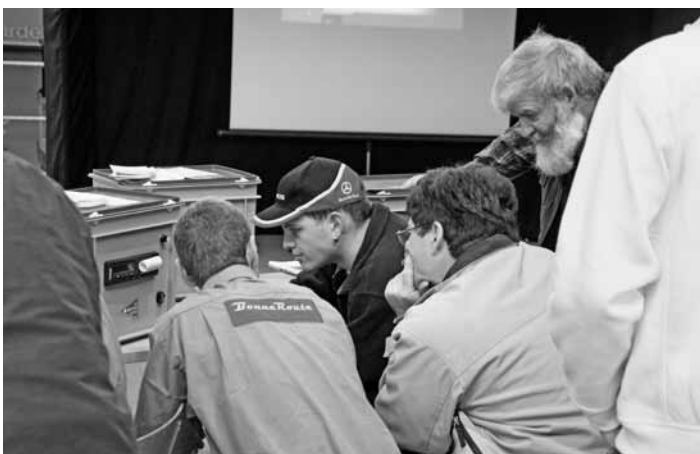
Geheimnisse des digitalen Fahrtschreibers

2009 über 11'000 Teilnehmertage. Im Jahr 2008 wurden die Kosten noch durch den Verkehrssicherheitsfonds und den Verband übernommen. Der administrative Aufwand war sehr gering. Für das Jahr 2009 wurde der Aufwand grösser. Insbesondere Qualitätskontrolle und Administration mussten aufgrund der Vorschriften erweitert werden. Durch die Einführung der CZV hat der Verkehrssicherheitsfonds seine Unterstützung massiv reduziert. Der Aufwand musste hauptsächlich von den Teilnehmern oder ihren Arbeitgebern bezahlt werden. Da wir sehr an einer reibungslosen Einführung der CZV interessiert sind, haben wir die Preise sehr knapp kalkuliert und darauf geachtet, Kurse gut zu füllen. Die Angebote wurden sehr gut genutzt. Durch unsere guten Vorbereitungen der letzten Jahre konnten wir auch mit steigendem Bedarf auf eine genügende Anzahl Kursleiter zählen. Auch die Administration wurde laufend erweitert und war den Ansturm gewachsen. Inzwischen (Stand Sept. 2010) arbeiten neben Teilzeitkursleitern beim Verband 9 festangestellte Kursleiter. Der Verband hat aus diesem Grunde seinen Fahrzeugpark ausgebaut.